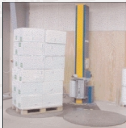
F1400 med dobbelt tallerken løsning