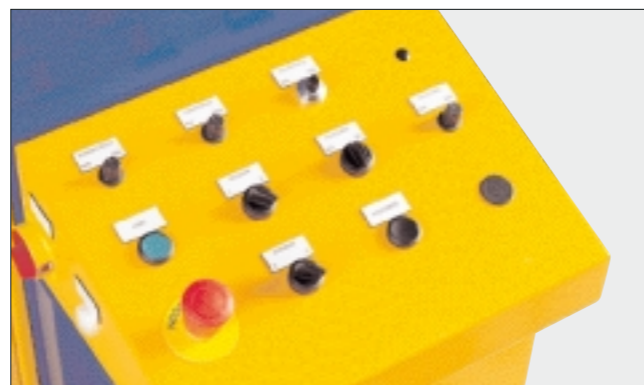
Standard bruger panel