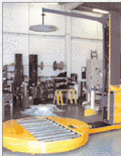
F1400 med rullebane og topholdeplade